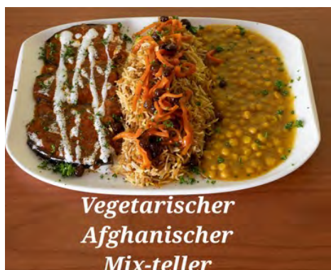
Vegetarischer Afghanischer Mix-teller