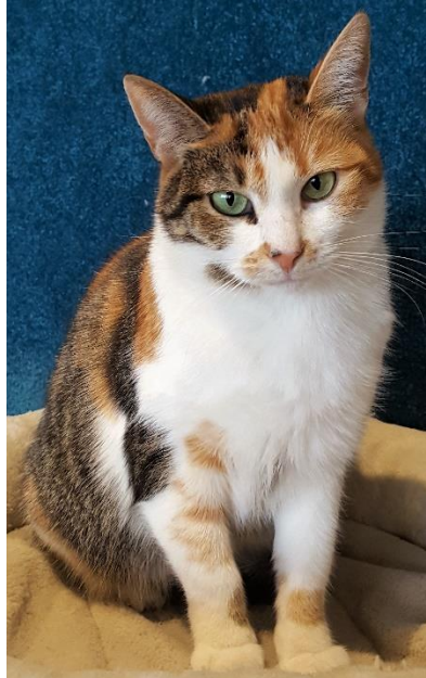
Lisa - geboren ca. 27.01.2016

Charakter: Lisa ist leicht schüchtern, lässt sich mit etwas Geduld dann aber gerne und ausgiebig streicheln, sobald sie Vertrauen gewonnen hat.