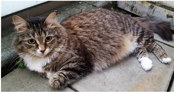
Stasja - geboren ca. 07.06.2016

Charakter: Lisa ist leicht schüchtern, lässt sich mit etwas Geduld dann aber gerne und ausgiebig streicheln, sobald sie Vertrauen gewonnen hat.