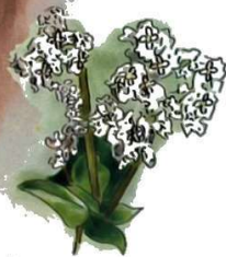
Fleurs de blé noir

Toutes nos galettes et crêpes sont préparées à la commande, jamais réchauffées et nécessitent du temps (C'est la tradition merci pour votre patience)