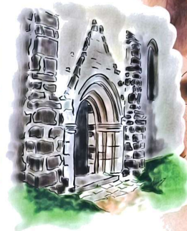
Chapelle Saint Jacques XIV e S en Saint Alban