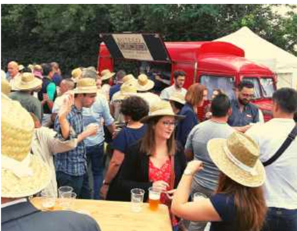
Inauguration showroom Point P Floirac - 450 personnes, juin 2019

Formules sur mesure de boissons et plateaux gourmands