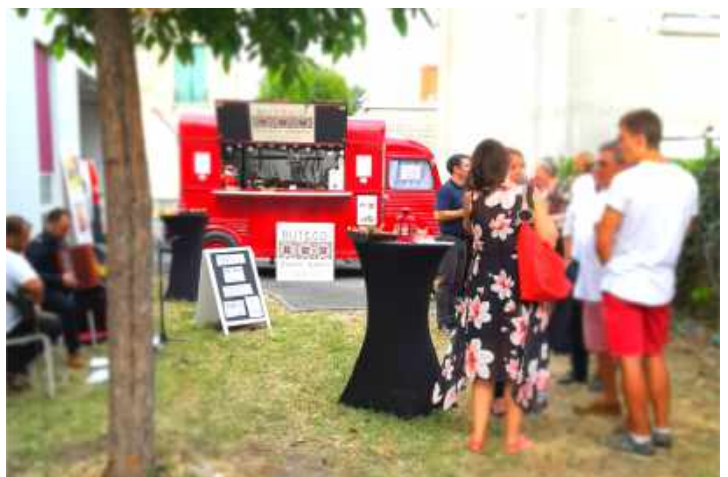
Réception à la Maison du Projet Bordeaux Euratlantique - 40 personnes