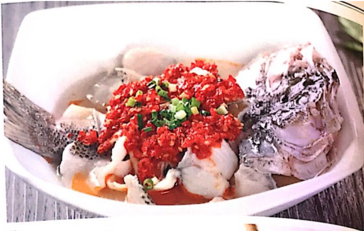
112 剁椒鲈鱼 17.80 € Gedämpfte wolfsbarsch mit pfeffer und chili Perch with Chopped Chili Pepper