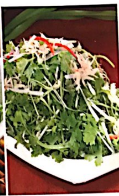
005 香菜拌淡皮 3.60€ Shrimps mit Koriander Dried Small Shrimps and Caraway