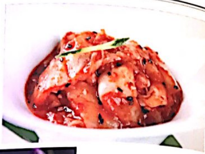
014 辣白菜 // 4.20€ Kimchi Cabbage in Chilli Sauce