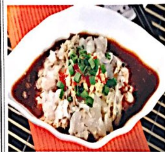
009 温州江蟹生 // 19.80€ Flusskrebis mit Ingwer und Pfeffer (Rohes) Crab in Sauce, Wenzhou Style

Alle Preise inklusive Bedienung und MwSt. In allen warmen Gerichten sind Geschmacksverstärker enthalten!