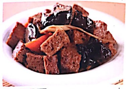
016 四喜烤麸 4.80€ Tofu nach Shanghai Art Marinated Wheat Gluten with Peanuts and Black Fungus