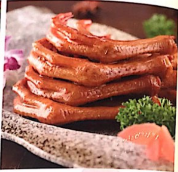
031 卤鹅掌 无 Entenfüße pikantes Marinated Goose Feet

Alle Preise inklusive Bedienung und MwSt. In allen warmen Gerichten sind Geschmacksverstärker enthalten!