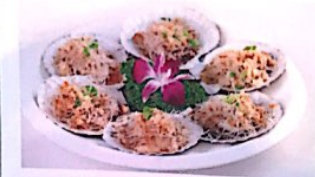
127 蒜蓉蒸扇贝 6.50 € (每只) Jacobmuschel Steamed Scallop with Garlic

Alle Preise inklusive Bedienung und MwSt. In allen warmen Gerichten sind Geschmacksverstärker enthalten!