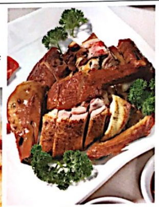
012 卤鸭 Smoked Duck, Wenzhou Style Geräucherter Enten nach Art von Wenzhou