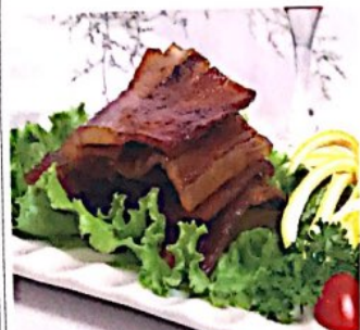
008 酱油肉 4.80€ Schweinbauch mit Sojasoße Marinated Pork