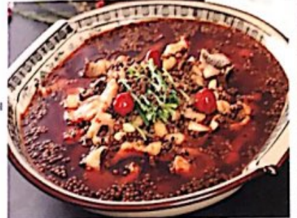
106 麻辣左口鱼 /// Gekocht steinbutt mit chili und pfeffer Hot & Spicy Halibut Fish 时价