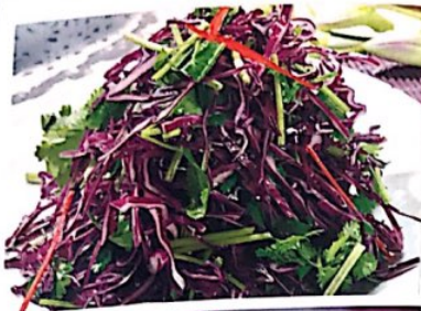
028 爽口紫甘蓝 3.80€ Rotkohlsalat Purple Cabbage in Sauce