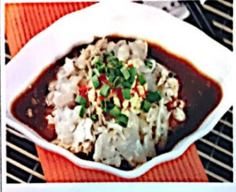
009 温州江蟹生 // 19.80€ Flusskrebs mit Ingwer und Pfeffer (Roh) Crab in Sauce, Wenzhou Style

Alle Preise inklusive Bedienung und MwSt. In allen warmen Gerichten sind Geschmacksverstärker enthalten!