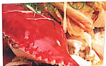
125 豆腐蒸江蟹 21.80 € Flusskrebse auf Tofu (Ger. impfte) Steamed Crab with Tofu