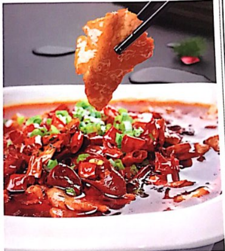
101 水煮牛肉 14.80€ Poached Sliced Beef in Hot Chili Oil Gehobter Rindfleisch mit Chili und Sojaprossen 肉味香辣, 软嫩, 易嚼, 吃时肉嫩新鲜, 汤红油亮, 麻辣味浓, 最宜下饭, 为家常美食之一。

🌶️微辣, leicht scharf; 🌶️🌶️中辣, mittel scharf; 🌶️🌶️🌶️特辣, sehr scharf