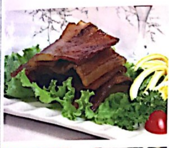
008 酱油肉 4.80€ Schweinbauch mit Sojasoße Marinated Pork