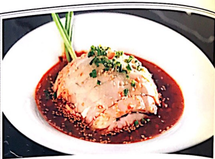
007 口水鸡 // 4.90€ Gekocht Hähnchenschenkel ( Scharf mit Knochen) Steamed Chicken with Chili Sauce