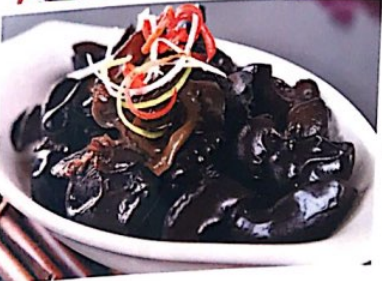
029 爽口木耳 4.50€ SchwarzerPilzsalat(Judasohr) Refreshing Black Fungus Salad