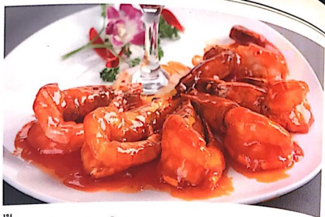
124 油爆大虾 18.80 € Gebr. garnelen mit süß-sauer soße Stir-Fried Prawn