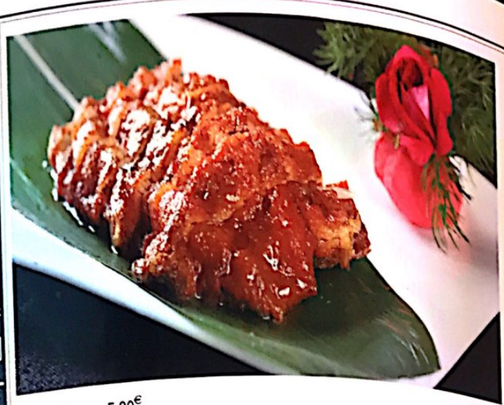
001 熏鱼 5.80€ Räucherfisch Smoked Fish

熏——俗作薰。会意。金文，上面象火焰冒出，中间是烟突（本古“烟”字），两点表示烟苔，下面是火焰，合起来是烟突冒烟。本义：火焰向上冒。《尔雅》“炎炎，熏也”，《诗·邶风·七月》“穹窒熏鼠，塞向墁户”。