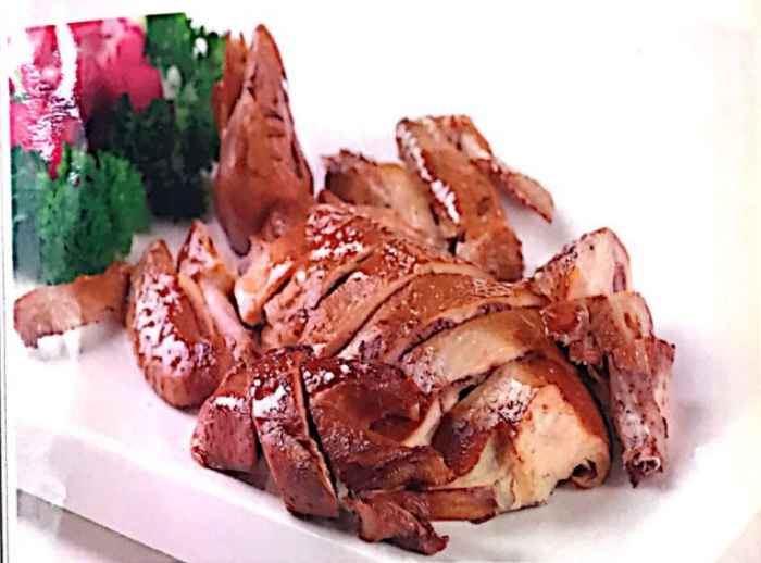
002 温州熏鸡 9.80€ Geräuchertes Hähnchen nach Art von Wenzhou Smoked Chicken, Wenzhou Style