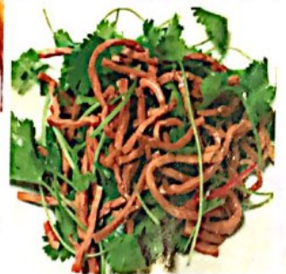
013 豆腐干丝拌香菜 4.80€ Tofustreifen mit Koriander Dried Tofu with Caraway

Alle Preise inklusive Bedienung und MwSt. In allen warmen Gerichten sind Geschmacksverstärker enthalten!