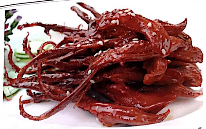
024 酱鸭舌 7.80 e Entenzunge Marinated Duck Tongue

🌶️ 微辣, leicht scharf; 🌶️🌶️ 中辣, mittel scharf; 🌶️🌶️🌶️ 特辣, sehr scharf