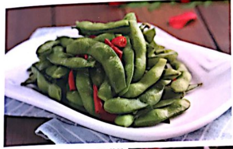
019 盐水毛豆 Boiled Green Soybeans Gekochte Sojabohnen