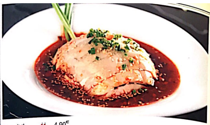
007 口水鸡 // 4.90€ Gekocht Hähnchenschenkel (Scharf mit Knochen) Steamed Chicken with Chili Sauce