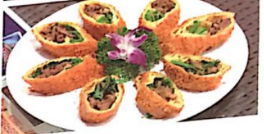
130 脆皮牛肉卷 13.80 € Rindfleisch Rolle Fried Egg Roll with Beef