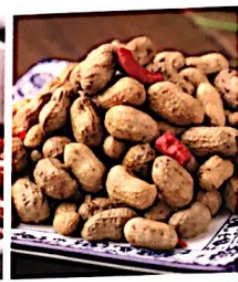
026 盐水花生 4.20 e Gekochte Erdnuss mit Schale Boiled Peanuts in Salty Water