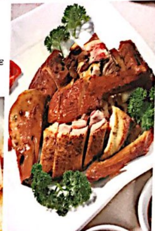
012 熏鸭 Smoked Duck, Wenzhou Style Geräucherter Ente nach Art von Wenzhou