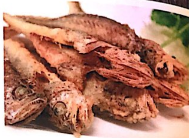
113 椒盐小黄鱼 15.80 € Frittierte Fisch Sautéed Shredded Potato with Chopped Chili Pepper