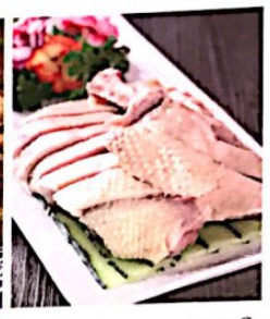
027 盐水鸡 5.20 e Salzig Hähnchen mit Knochen Boiled Chicken with Salt

Alle Preise inklusive Bedienung und MwSt. In allen warmen Gerichten sind Geschmacksverstärker enthalten!