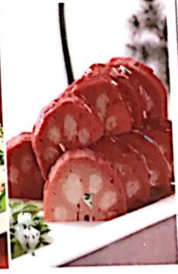
006 蜜汁莲藕 5.20€ Lutuosfrucht mit Honig Lotus Roots Stuffed with Honey Sauce

Alle Preise inklusive Bedienung und MwSt. In allen warmen Gerichten sind Geschmacksverstärker enthalten!