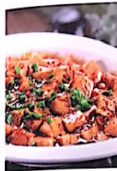
107 麻婆豆腐 // 9,80 € Tofu mit Schweinehackfleisch Mago Tofu (Stir-Fried Tofu in Hot Sauce)