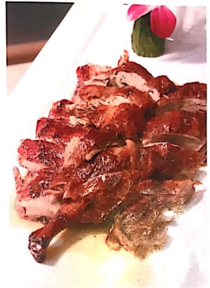
116 明炉烤鸭 16.80 € Roast Duck (Half) Grill Ente

Alle Preise inklusive Bedienung und MwSt. In allen warmen Gerichten sind Geschmacksverstärker enthalten!