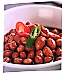
025 老醋花生 4.50 e Erdnuss mit Reissessig Seasoned Peanuts with Aged Vinegar