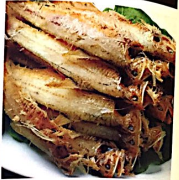
022 凤尾鱼 9.80 e Frittierte Fisch Phoenix Tail Fish