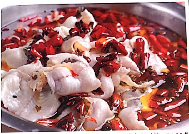
102 水煮鱼片 14.80€ Gekocht Fisch mit Chili und Sojaprossen Fish Filets in Hot Chili Oil

Alle Preise inklusive Bedienung und MwSt. In allen warmen Gerichten sind Geschmacksverstärker enthalten!