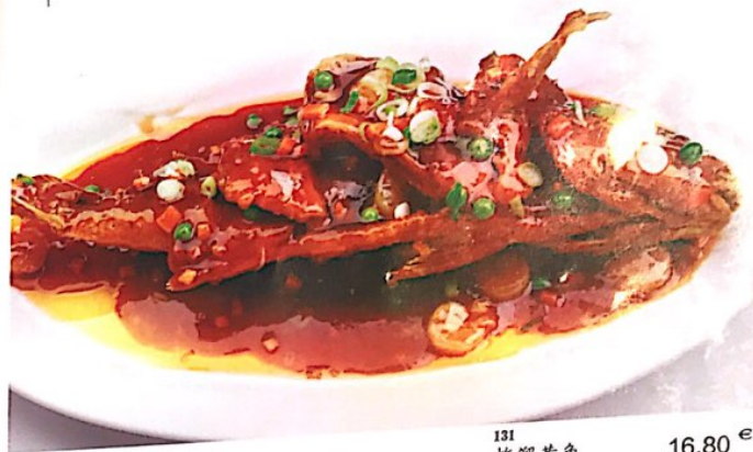
131 炸溜黄鱼 16.80 € Gebr. Gelberfisch süß-sauer Fried Yellow Fish

Alle Preise inklusive Bedienung und MwSt. In allen warmen Gerichten sind Geschmacksverstärker enthalten!