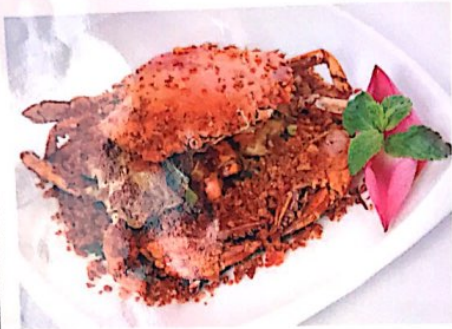
114 避风塘炒蟹 20.80 € Gebratene Krebs Fried Crab Meat with Dry Spicy and Garlic

Alle Preise inklusive Bedienung und MwSt. In allen warmen Gerichten sind Geschmacksverstärker enthalten!