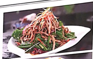
128 爆炒牛肉丝 13.80 € Gebr. Rindfleisch Stir-fried Beef

微辣, leicht scharf; 中辣, mittel scharf; 特辣, sehr scharf