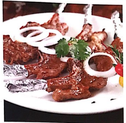
115 羔羊排 6 块 16.80 € Pan-fried Lamb Chop Grill Lammssteak

微辣, leicht scharf; 中辣, mittel scharf; 特辣, sehr scharf