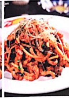
108 鱼香肉丝 / 9,80 € Yu-Xiang Gebratene Schweinefleisch (Süß Sauer) Shredded Pork with Garlic Sauce