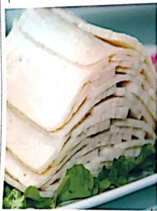
023 温州鱼饼 5.90 e Fischfrühdellen Fish Pie, Wenzhou Style

Alle Preise inklusive Bedienung und MwSt. In allen warmen Gerichten sind Geschmacksverstärker enthalten!