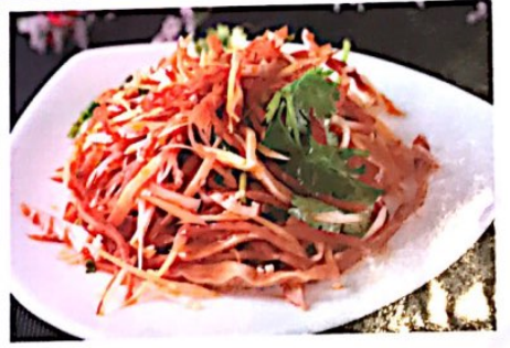
020 香酥拌猪耳 // 4.80€ Pigs Ear with Caraway Schweinohren mit Fenchel

Alle Preise inklusive Bedienung und MwSt. In allen warmen Gerichten sind Geschmacksverstärker enthalten!