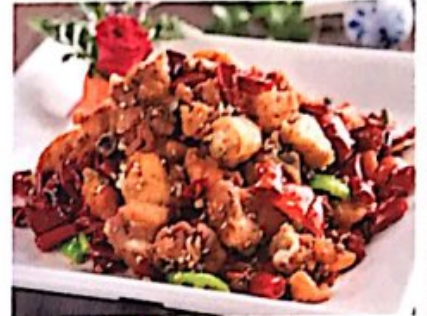
105 歌乐山辣子鸡 // Gebratenes Hähnchen mit Chili Sauteed Diced Chicken with Chili Pepper 11,80 €

/ 微辣, leicht scharf; // 中辣, mittel scharf; /// 特辣, sehr scharf