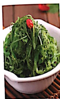
004 凉拌海藻 4.20€ Seetangsalat Mixed Seaweed with Pepper