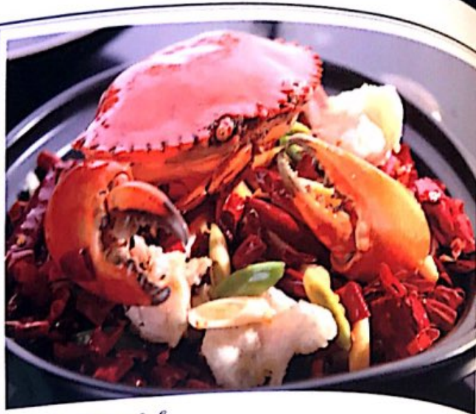
103 香辣蟹 /// 20,80 € Gebratene Krabbe Sauteed Crab in Hot Spicy Sauce