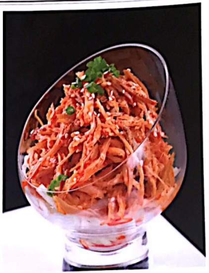
018 手撕鸡 // 5.80€ Hand-Shredded Braised Chicken (Hühnerfleischsalat/Scharf)

微辣, leicht scharf; // 中辣, mittel scharf; /// 特辣, sehr scharf