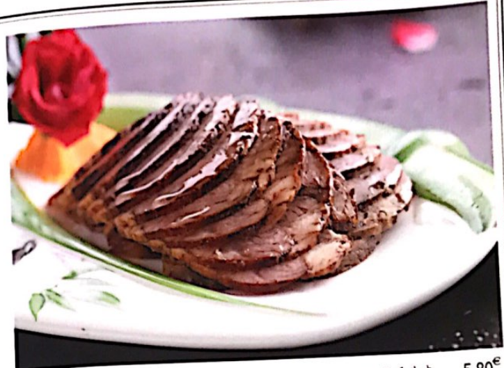
003 五香牛肉 5.80€ Rindfleisch pikantes Spiced Beef

熏——俗作薰。会意。金文，上面象火焰冒出，中间是烟突（本古“烟”字），两点表示烟苔，下面是火焰，合起来是烟突冒烟。本义：火焰向上冒。《尔雅》“炎炎，熏也”，《诗·邶风·七月》“穹窒熏鼠，塞向墁户”。