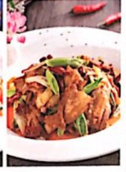
109 回锅肉 // 12,80 € Gebratene Schweinebrust mit Chili Double-Cooked Pork Slices

Alle Preise inklusive Bedienung und MwSt. In allen warmen Gerichten sind Geschmacksverstärker enthalten!