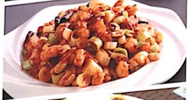
129 宫保鸡丁 10.80 € Gebratenes Hähnchenfleisch mit gemüse nach kung pao Art Kung Pao Chicken