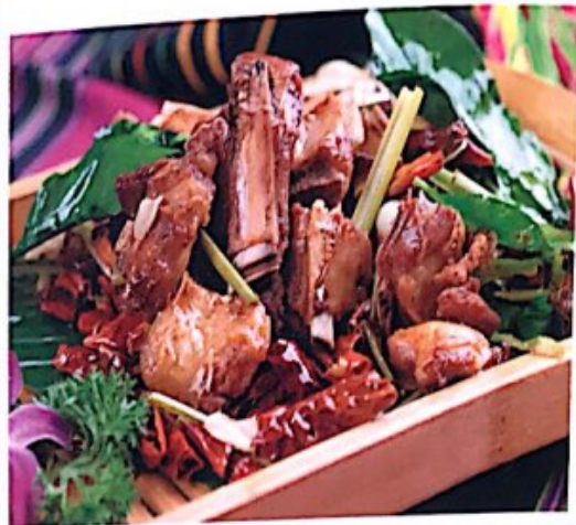
104 香辣羊排骨 /// Hot and Spicy Lamb Chop Lammtypchen mit Chili 13,80 €

Alle Preise inklusive Bedienung und MwSt. In allen warmen Gerichten sind Geschmacksverstärker enthalten!