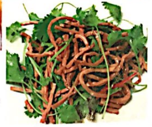
013 豆腐干丝拌香菜 4.80€ Tofustreifen mit Koriander Dried Tofu with Caraway

Alle Preise inklusive Bedienung und MwSt. In allen warmen Gerichten sind Geschmacksverstärker enthalten!