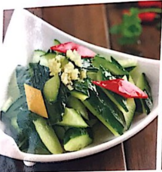
030 拍黄瓜 3.50€ Schlangengurke mit Sojasosse und Knoblauch Cucumber with Garlic