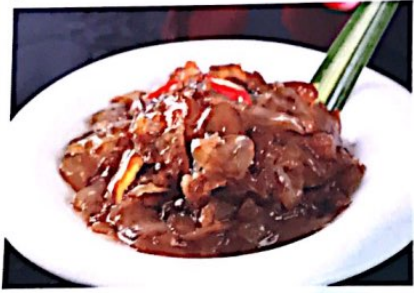
017 凉拌海蜇头 // 7.80€ Quallenstreifen mit Gurken Mix Jellyfish

Alle Preise inklusive Bedienung und MwSt. In allen warmen Gerichten sind Geschmacksverstärker enthalten!