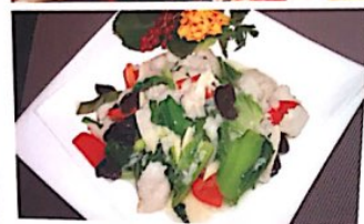
126 滑炒鱼片 13.80 € Gebratener Fisch Fried Fish Sliced with Vegetables