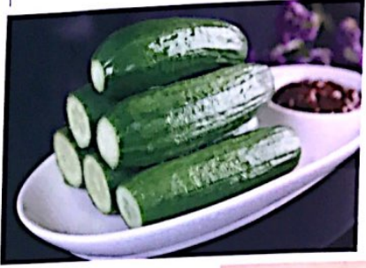
015 蒜蓉小黄瓜 3.60€ Mini Gurke mit Soße Baby Cucumber with Soya Bean Paste