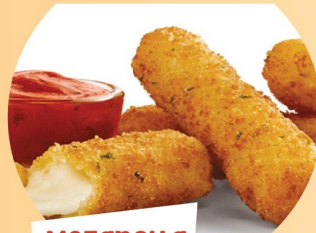
Mozarella 7 TL

Etlerimizi Dondurmuyoruz Taze Hazırlıyoruz