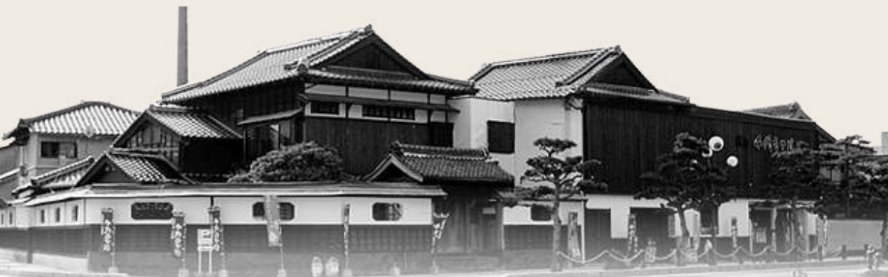
Chiyomusubi Sake Brewery