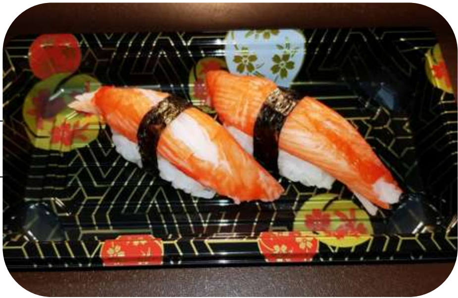
GRONGO € 4