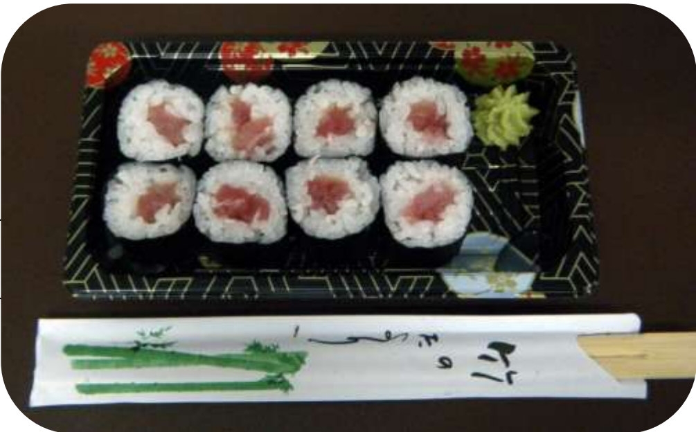
TONNO € 6