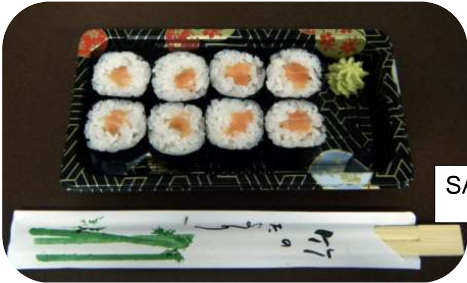
HOSOMAKI 8 Pz Roll di riso ripieno e sottile alga esterna