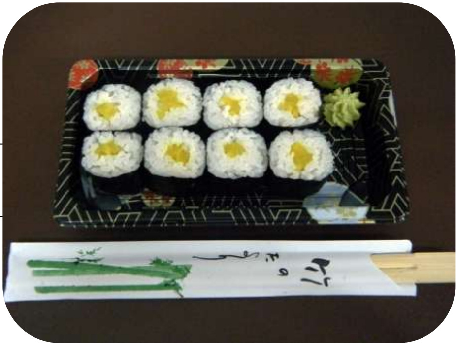
TAKUAN Rafano Giapponese € 4