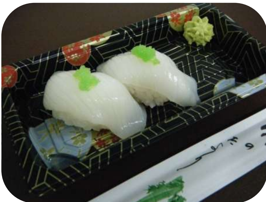
CALAMARO € 3