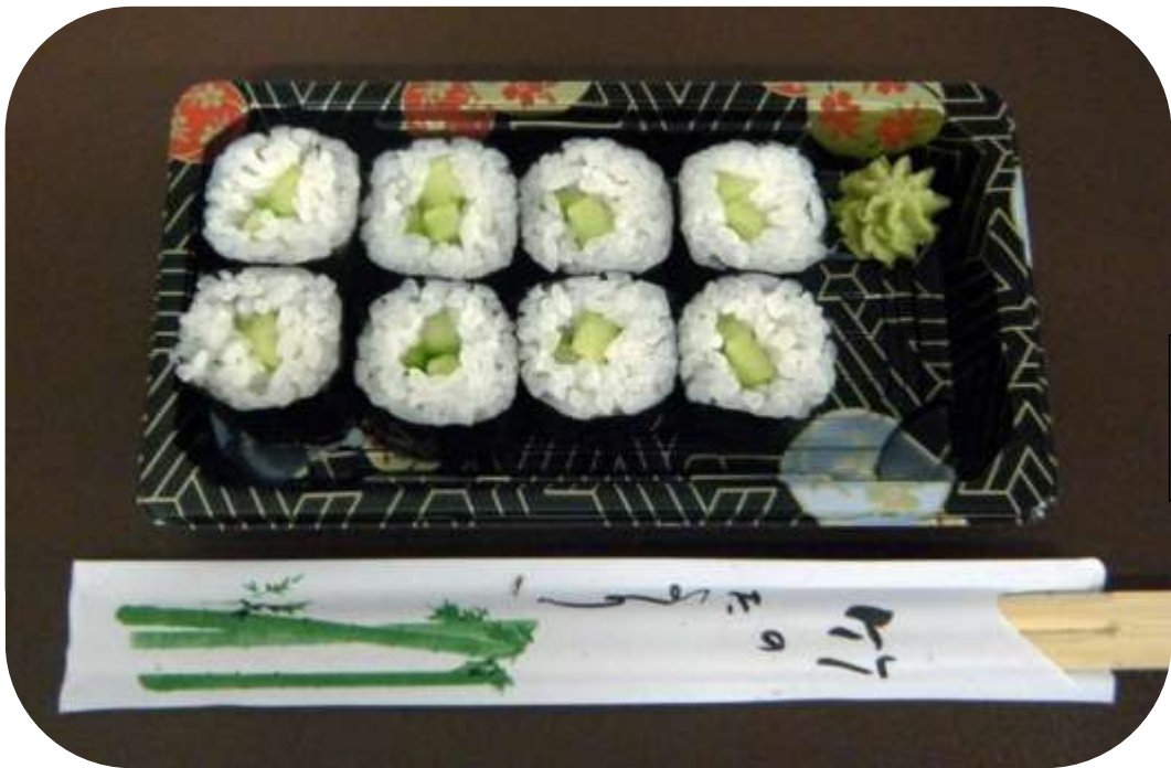
KAPPA Cetriolo € 4