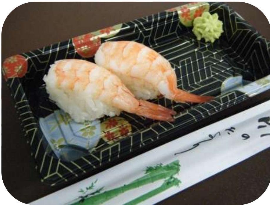
GAMBERO COTTO € 3