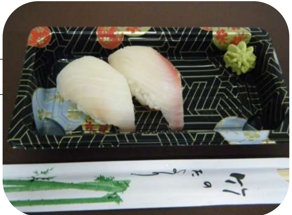
ORATA € 4