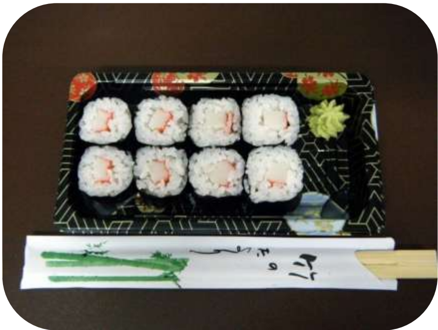
GRANCHIO € 5